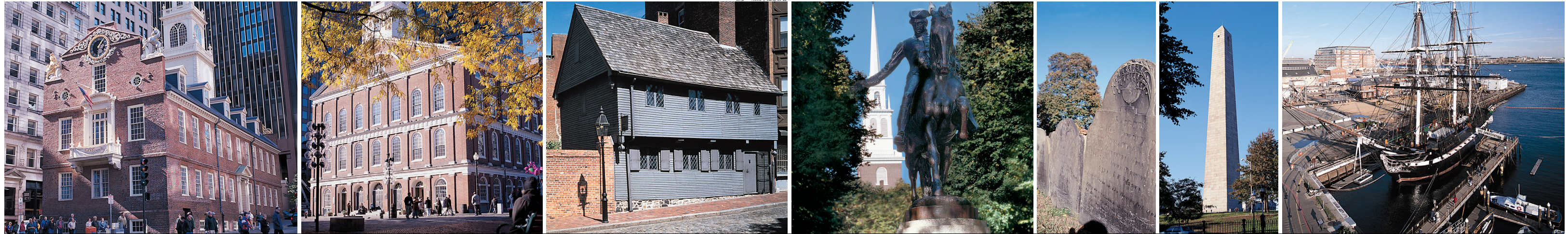
保罗·瑞威尔纪念协会

查尔斯顿海军造船厂/宪法号护卫舰 独立战争后，市民们组建、资助了一支海军，表现出他们捍卫新取得的自由和经济独立的决心。1800 至 1974 年间，在查尔斯顿海军造船厂制造、维修、装配美国海军军舰。现在，造船厂停泊着世界上最老的服役战舰“宪法号”护卫舰，并设有“宪法号”护卫舰博物馆。卡辛·杨号驱逐舰在造船厂的干船坞中经过改造和现代化翻修，代表着二战期间在此建造的船只类型。